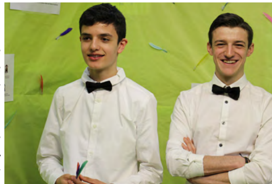
Les jeunes ont envie d'entreprendre. Aidez nous à les soutenir

EPA Normandie est une association Loi 1901 reconnue d'intérêt général. Pour toute adhésion à nos valeurs, vous pouvez bénéficier d'une réduction d'impôt allant jusqu'à 66 % (articles 200 et 238 bis du CGI). Ainsi, une cotisation de